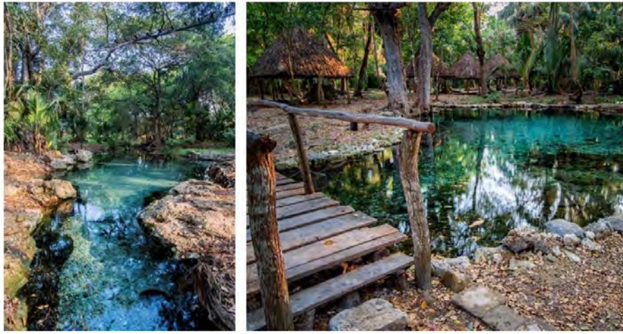
Figura 4. Imagen de los dos cenotes que se ubican dentro del Centro Ecoturístico Ich Ha Lol Xaan . Los cenotes son considerados el principal atractivo turístico del lugar, ya que gracias a su poca profundidad, son propicios para el nado recreativo.