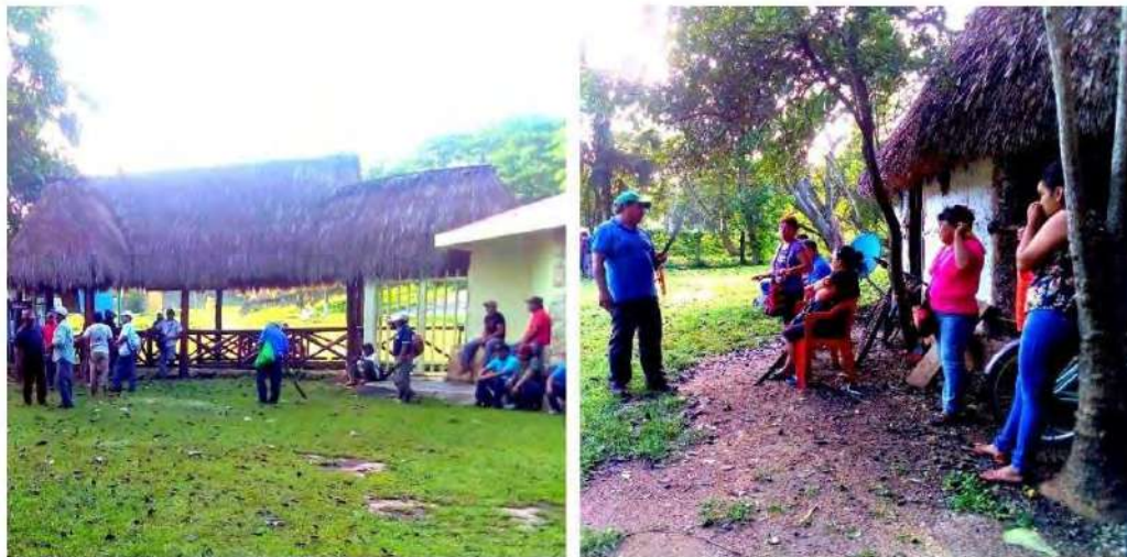
Figura 8. Grupos de socios del Centro Ecoturístico Ich Ha Lol Xaan . Al inicio de las actividades diarias, los socios se encuentran en la entrada del Centro para comenzar las labores de mantenimiento del lugar (imagen de la izquierda). Las cuatro mujeres que participan en el emprendimiento usualmente esperan a que el socio que coordina las actividades del Centro les asigne tareas de limpieza (imagen de la derecha).

abril), a los socios que asisten a trabajar al Centro se les asigna una tarea específica (e.g., vigilancia, cobro en la taquilla, guía de visitantes) (Figura 8).