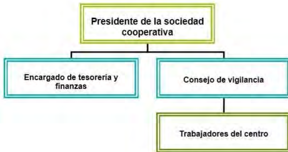
Figura 3. Organigrama de la sociedad cooperativa del Centro Ecoturístico Ich Ha Lol Xaan , Hampolol Campeche.

Al momento del estudio, la cooperativa estaba conformada legalmente por 46 miembros (42 hombres y 4 mujeres), todos con su titularidad ejidal y residentes de la localidad de Hampolol, Campeche.