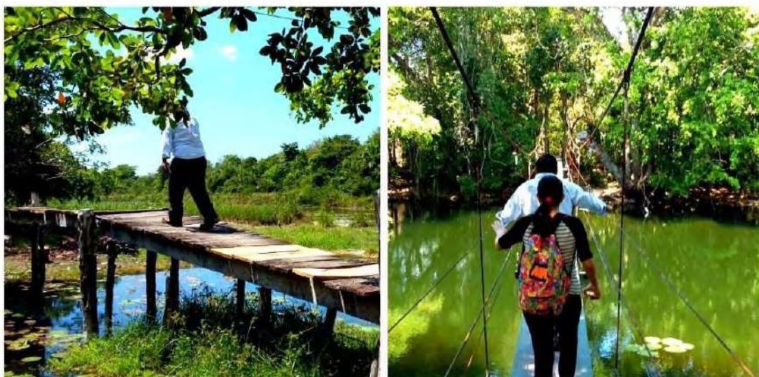
Figura 10. Socio guía caminando por el puente que sirve como camino de acceso hacia los cenotes (imagen izquierda). Guía caminando delante de una visitante del Centro sobre el puente colgante que atraviesa el Río Verde (imagen derecha).

En temas de seguridad del turista, se encontró que los visitantes de Ich Ha Lol Xaan reciben recomendaciones para caminar por senderos con la supervisión de guías locales (39%), alertas preventivas (vía señalización) en el sitio (34%) y acciones de vigilancia especialmente durante la temporada alta (27% de los entrevistados) (Figura 10).