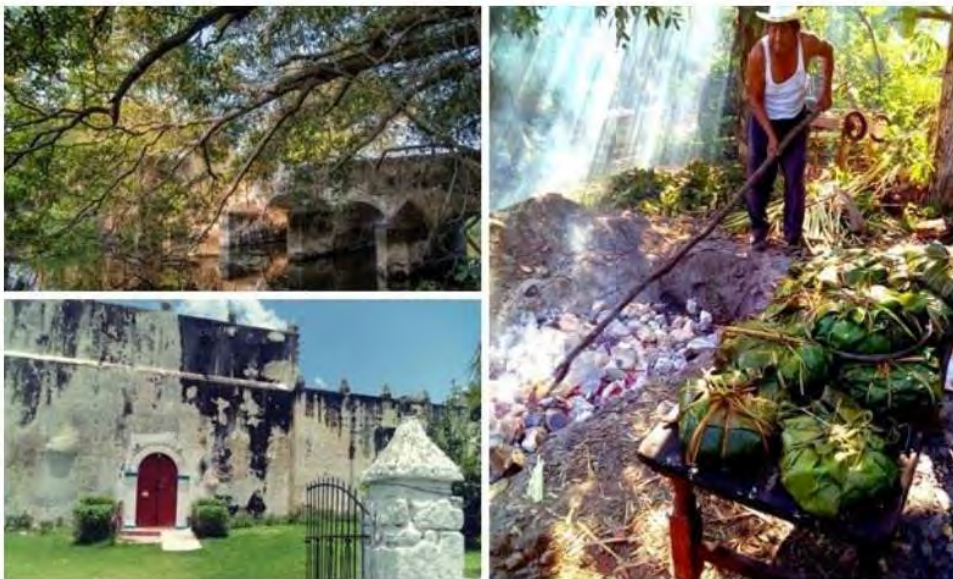
Figura 7. Puente colonial Carlota, monumento virreinal que forma parte del patrimonio cultural histórico de la comunidad (costado superior izquierdo). Iglesia de Hampolol con más de 400 años de antigüedad, construida en el Siglo XVII (costado inferior izquierdo). Habitante de la comunidad maya de Hampolol en el proceso tradicional de elaboración del PIB enterrado, esto como parte de la celebración del Hanal Pixán para recibir a los finados (costado derecho).

La comunidad de Hampolol fue fundada poco después del establecimiento de la ciudad de San Francisco de Campeche en el año de 1540 y era paso obligado en el camino hacia el norte de la Península de Yucatán (Ojeda y Benavides 2010). Por ser uno de los pueblos más antiguos de Campeche, Hampolol fue escenario de diversos hechos históricos (e.g., guerra de castas, movimiento independentista, paso de la emperatriz Carlota por el Puente de Hampolol) (Ojeda y Benavides 2010). Asimismo, el pueblo conserva varias de sus tradiciones culturales, tales como la fiesta de San Antonio de Padua, el baile de “La cabeza de cochino”, y la celebración del Hanal Pixán (Día de muertos) (Figura 7).