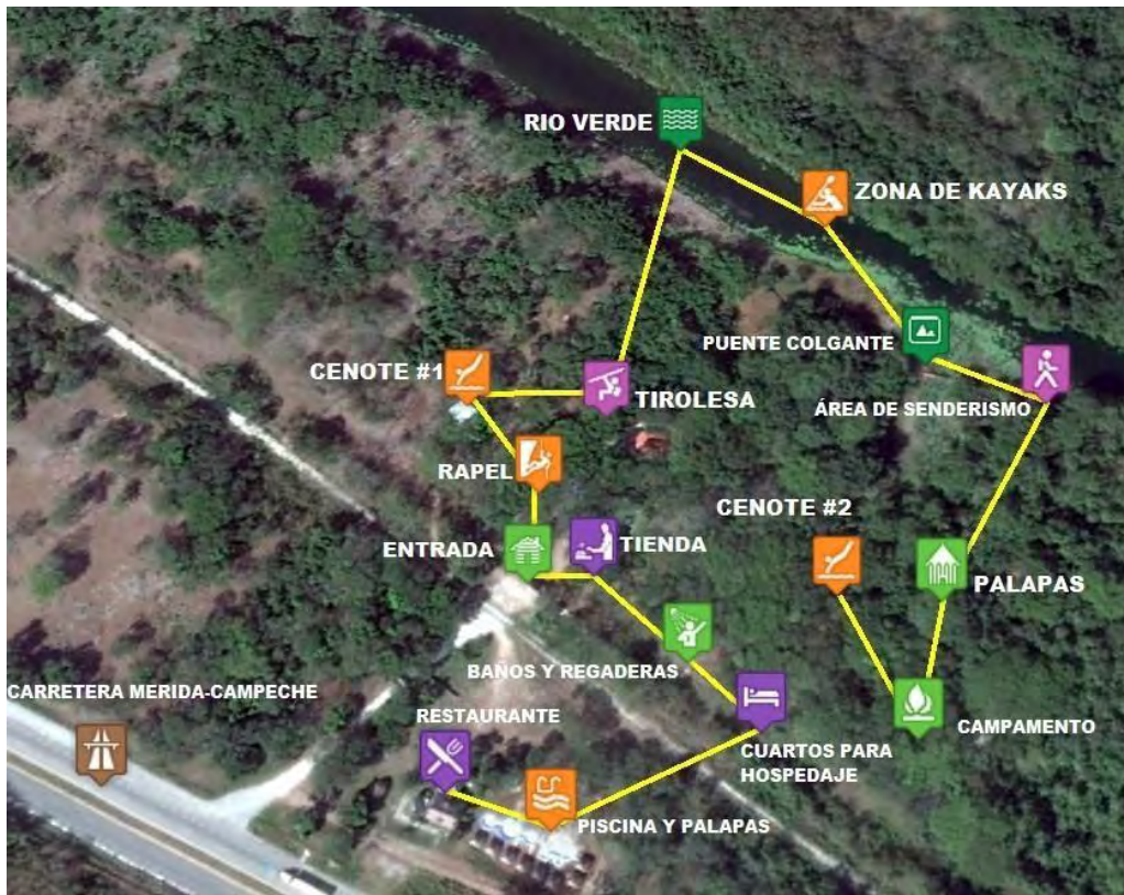
Figura 6. Croquis de la infraestructura ecoturística de Ich Ha Lol Xaan .

A los ojos del visitante, el Centro constituye un importante lugar de belleza escénica en la región costera de Campeche, siendo el centro ecoturístico más reconocido en las cercanías de la RBLP (ubicándose a 2 km de distancia de su límite sureste). Este centro ecoturístico que se ha venido implementando en la última década, ha sobrevivido a diversos desafíos de organización y operación (Práctica-EH 2012). Esto, a diferencia de otros proyectos ecoturísticos que de igual forma fueron implementados en la zona de influencia de la RBLP, pero que no lograron desarrollar un sentido organizacional, asumiendo compromisos y continuidad del proyecto.