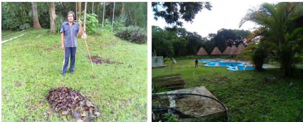
para realizar labores de limpieza y mantenimiento del lugar (Figura 9).

En temporadas bajas (mayo-junio, septiembre-enero), los 46 socios se dividen en dos grupos y asisten al Centro de forma rotativa una vez por semana