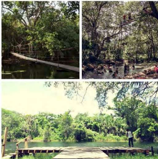
Figura 5. Instalaciones asociadas a los espacios de agua en Ich Ha Lol Xaan . Se puede observar el puente colgante sobre el Río Verde (imagen superior izquierda). Se muestran visitantes del Centro disfrutando uno de los dos cenotes (imagen superior derecha), próximos a un embarcadero central hacia el Río Verde (imagen de abajo)